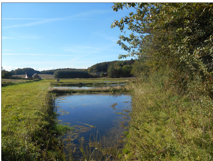
Figur 1. Minivådområdet Fensholt i oktober 2020. Fra indløb til sedimentationsbassinet.

Minivådområder med overfladestrømning modtager drænvand fra markdrænen og har til formål at fjerne kvælstof, inden vandet ledes videre. De danske minivådområder, som er godkendt under den kollektive ordning, er alle lavet efter det samme grundlæggende