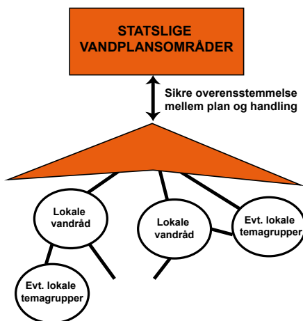
Figur 3. Bud på fremtidens vandrådsstruktur, hvor det er vigtigt at sikre overensstemmelse mellem planlægning og handling.

De første danske og udenlandske erfaringer med vandråd og lokal involvering har demonstreret ret overbevisende, at lokal forankring og aktiv involvering er nøglen til en succesfuld vandforvaltning. At der kan findes løsninger i samspil, når der gives en ramme og økonomi for spillet og der gives reel indflydelsesmulighed. Det kan dog diskuteres, hvilken type inddragelse af viden der har været tale om, og om fremtidens vandråd kunne formuleres i en anden type struktur, så den lokale og aktive involvering sikres en bedre repræsentation?