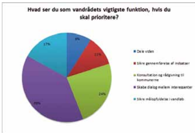
Figur 1. Hvad ser du som vandrådets vigtigste funktion, hvis du skal prioritere?