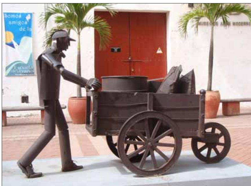
Skraldemanden arbejder. Carthage des Indes, Columbia