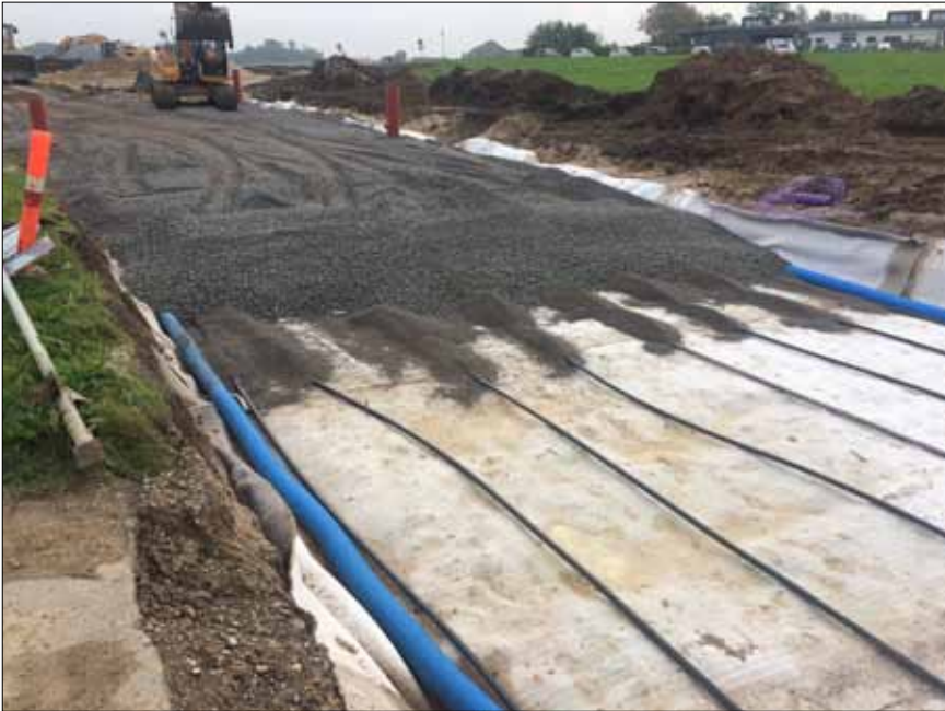
Figur 3. Klimavejen i anlægsfasen. I baggrunden ses Børnehuset. Med hvidt ses bentonitmåtterne. Det nederste lag af jordvarmeslangerne kan ses oven på bentonitmåtterne. Langs vej-kassens sider ses de blå afdræningsrør

gennem flowmålerne, hvorved den samme vandmængde principielt kan være målt to gange. De opsamlede data skal derfor ses i dette lys. Fra den installerede Davis Vantage pro2 vejrstation placeret umiddelbart ved siden af klimavejen er der målt en total nedbør i år (01-01-2019 til 16-09-2019) på i alt 546 mm, hvilket giver en total nedbørsmængde for hvert asfaltstykke på ca. 110 m 3 . For samme tidperiode er der målt 95 m 3 og 125 m 3 vand fra afdræningssystemerne under henholdsvis den traditionelle asfalt og den permeable asfalt. Omend aflæsningerne skal tages med forbehold ses det, at asfaltstykket med den permeable belægning umiddelbart har kunnet håndtere alt nedbøren på vej-overfladen, imens den traditionelle asfalt og det dertilhørende afdræningssystem ikke har kunnet opsamle alt nedbøren. Dette er også i overensstemmelse med de målte afdræningskapaciteter for den permeable asfalt, som indikerer, at alt nedbør uden problemer drænes gennem asfalten. Ovenstående potentielle