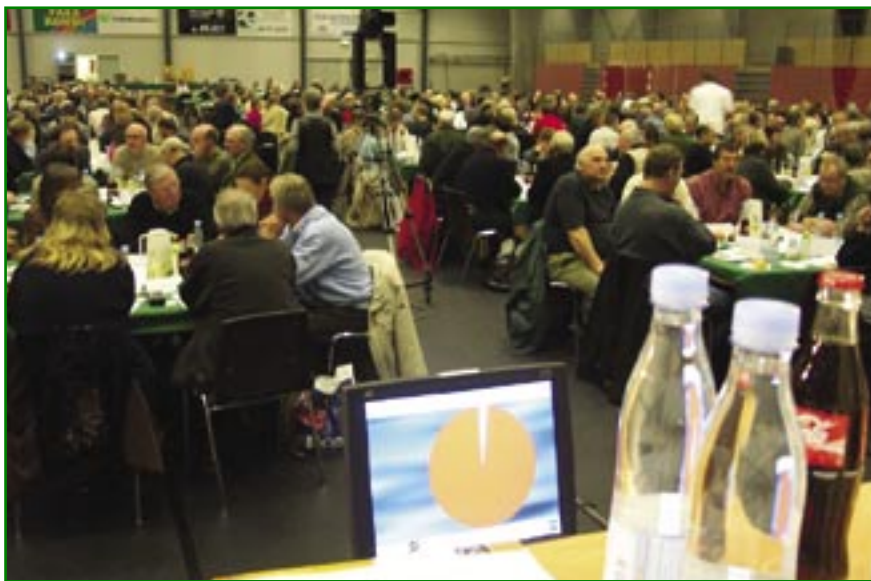
Figur 5. Fra Borgertopmødet.

SØREN MARK JENSEN har fungeret som projektkoordinator på Pilotprojektet Nationalpark Kongernes Nordsjælland, Skov- og Naturstyrelsen. E-mail: smj@sns.dk