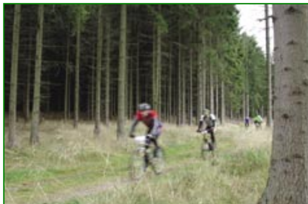
Figur 3. Nationalparken har så stor en størrelse, at der både kan blive plads til urørte naturområder og til aktiviteter som orienteringsløb og mountainbikes.

sammenhængende faser. I fase 1 afholdtes store åbne møder for borgere i Frederiksborg Amt, hvor projektets styregruppe og sekretariat orienterede om projektet, og hvor borgere fik lejlighed til at lufte umiddelbare synspunkter og ideer. Derefter var der en fase, hvor interesserede borgere arbejdede ihærdigt med at formulere og uddybe konkrete forslag til nationalparkens indhold og afgrænsning. Dette arbejde skete i en række åbne temagrupper. Arbejdet i grupperne blev guidet af en vejledning og af miljø- og naturmedarbejdere fra amtet, de involverede kommuner og fra det lokale statsskovdistrikt.