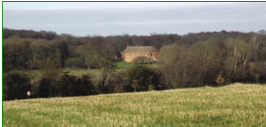
Figur 4. Området rummer mange kulturhistoriske værdier. Her Esrum Kloster, som stammer fra middelalderen.

Der er næppe tvivl om, at nogle af nationalparkerne får grønt lys fra det politiske niveau. Det bliver imidlertid spændende at se, hvor stor vægt den Nationale Følgegruppe og mini-