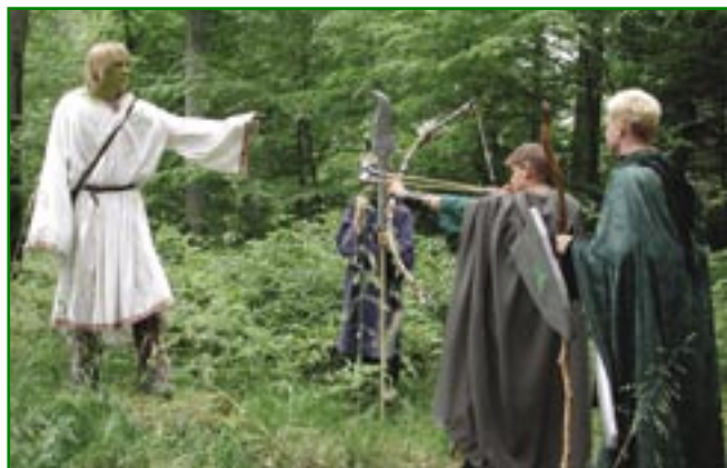
Figur 2. Der er mange, som allerede i dag bruger Nordsjællands skove til rollespil.