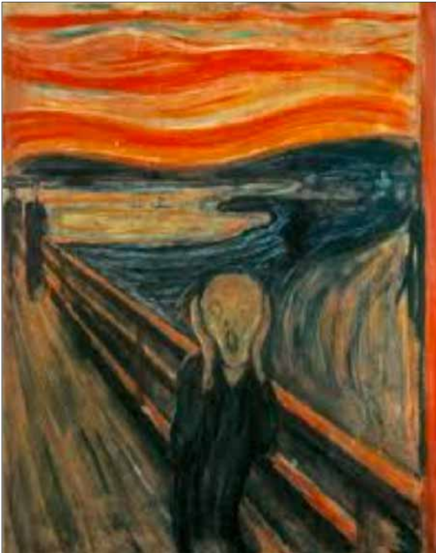
Figur 4, Edvard Munch, Skriet , 1893. Nationalgalleriet, Oslo.