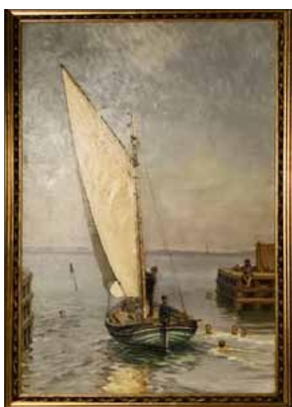
Figur 7. Vilhelm Arnesen, Badende børn Nordsjælland , 1911. Privateje. (Aquafoto 2019, Danmark)