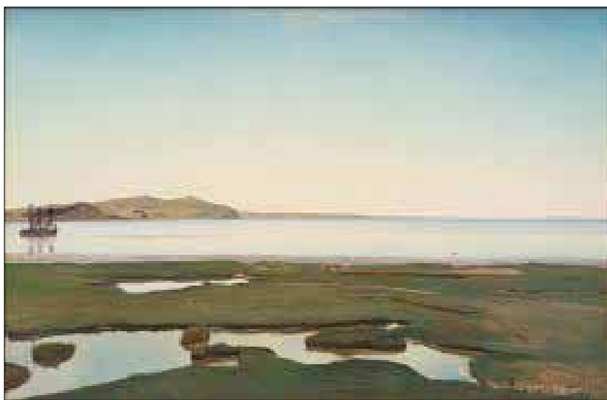
Figur 3. Laurits Andersen Ring, Sommerdag ved Roskilde Fjord, 1900. Randers Kunstmuseum.

Personen på broen skriger, måske af vandskræk. Og farverne er med til at fremmane den uhyggelige sindstilstand. Da Munch malede billedet var vandet endnu ikke forurenset med antibiotika fra lakseopdræt. Der findes flere oliemalede versioner af Skriget