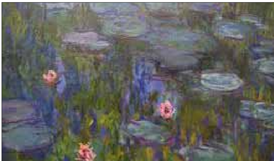
Figur 6. Claude Monet, Nymphéas , 1915. Neue Pinakothek, München