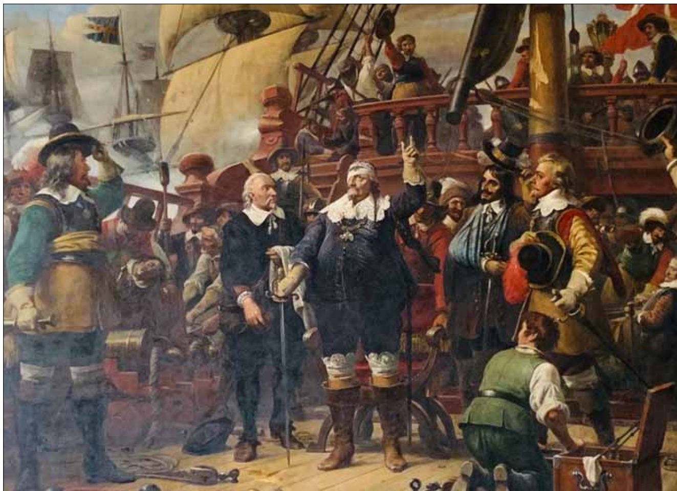
Figur 2. Wilhelm Marstrand, Chr. 4 på Trefoldigheden, 1865. Roskilde Domkirke

Roskilde Fjord. En sommerdag så dårende dejlig, som kunne have været malende beskrevet af H. C. Andersen 30 år tidligere. Ring har, inspireret af de nederlandske malere, lagt horisontlinien lavt for at kunne vise den blå himmel, der spænder fra det spæde hvidblå ved vandoverfladen til det himmelblå øverst. Billedet sitrer af sommer, se figur 3. I år 1900 da billedet blev skabt var sommeren varm: maximumtemperaturer i juni, juli og august var hhv. 30.7, 32.6 og 31.5 grader. Det fremgår også af billedet at det ikke er malet 23. juni, for Sankthans år 1900 var skyet og med stedvis regn. Nedbøren var iøvrigt omkring 60 mm i hver af de 3 sommermåneder /2/ så der har været mulighed for at finde mange fine sommerdage til malearbejdet ved den på det tidspunkt rene fjord. Billedet af Roskilde Fjord er med rette med i den danske kulturkanon indenfor billedkunst.