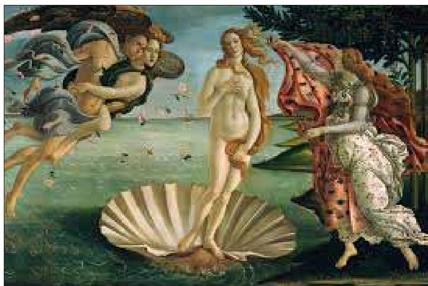
Figur 1. Sandro Botticelli, Venus fødsel, 1484-1486. Galleria degli Uffici, Firenze

Den danske maler Laurits Andersen Ring malede et af sine smukkeste malerier ved