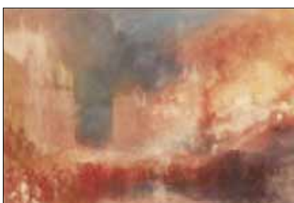
Figur 8. John Millard William Turner, Parlamentet brænder , akvarel, 1835-36. Tate, London